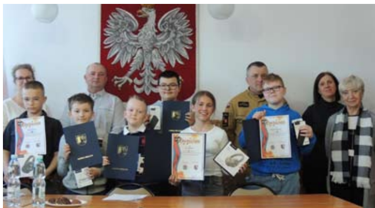
GMINNY TURNIEJ WARCABOWY