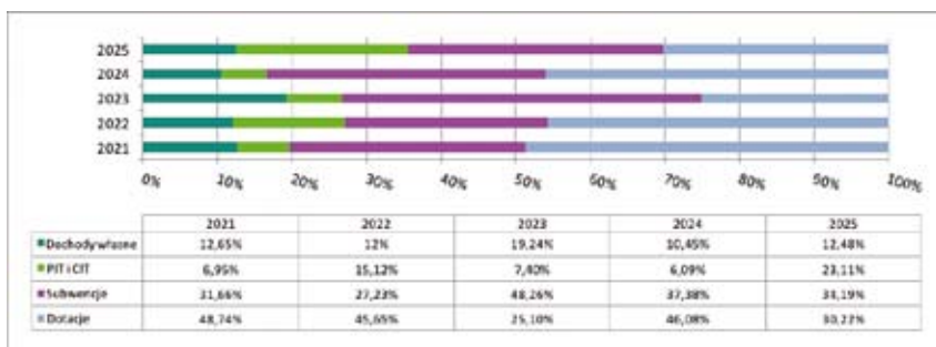
Wykres 2: Dochody Wilków wg kategorii w 2025 roku w porównaniu do lat 2021-2024

*z uwagi na pośredni charakter w ramach zestawienia z dochodów własnych wydzielono PIT i CIT